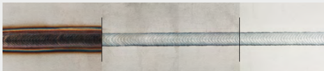
/ CrNi-teräs ennen puhdistusta