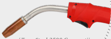
/ TransSteel 2500 Compactiin räätälöity MTG 2500 S -teräshitsauspoltin

/ Ikkuna, josta voidaan tarkistaa jäljellä olevan langan määrä ja varmistaa, että kela on täysin eristetty.