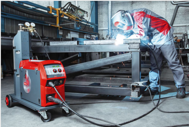
/ TransSteel 2500 Compact – tilaa säästävä, tehokas vaihtoehto verstaaskäyttöön

/ TransSteel 2500 Compactin monijänniteversio tarjoaa lisäetuja: sitä voidaan käyttää yksivaiheisesti 230 V:n virtasyötöllä ja näin ollen myös sellaisissa paikoissa, joissa kolmivaiheista sähkönjakelua ei ole käytettävissä.